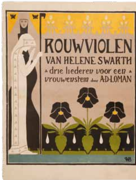
Afb. 5. Rouwviolet, muziekblad, ontwerp: H.P. Berlage (1895).