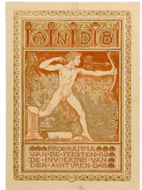
Afb. 4. ANDB, Programma van de feesten bij de invoering van den achturen-dag , ontwerp: Richard Roland Holst (1911).

"Er zijn er heel veel. Ik kan daar wel een heel nummer van 'Rond 1900' mee vullen. Bovendien zijn er zoveel verschillende vormen van gelegenheidsgrafiek. We hebben het nog niet eens gehad over advertenties, tijdschriftomslagen, diploma's, muziekbladen (afb. 5) enzovoort. Zelfs