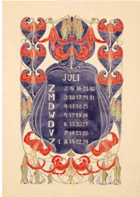
Afb. 6. Boekaankondiging, ontwerp: Theo Nieuwenhuis (1899).