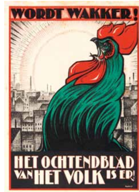
Afb. 3. Reclamebiljet voor Het Volk , ontwerp: Albert Hahn jr. (ca. 1930).

Omdat ik zelf uit een 'rood nest' kom, heb ik ook wat met Amsterdamse School drukwerk voor de arbeidersbeweging: het morgenrood en de kraaiende haan (afb. 3). Toch ligt mijn voorkeur bij de periode rond 1900. Even uitleggen. Ik maak een onderscheid tussen de internationale Art Nouveau of Jugendstil die met zwierige lijnen en bloemen- en plantenmotieven vaak zeer figuratief is, en de Nederlandse variant: de Nieuwe Kunst. De Nieuwe Kunst is over het algemeen minder figuratief en zwierig. Wel nog symbolisch, maar organischer of juist geometrischer en wat ingetogener. Daar hou ik meer van."