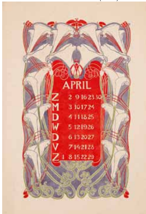
Afb. 6a en 6b. Ontwerptekening en proefdruk voor een kalenderblad met aronskelken (1904).