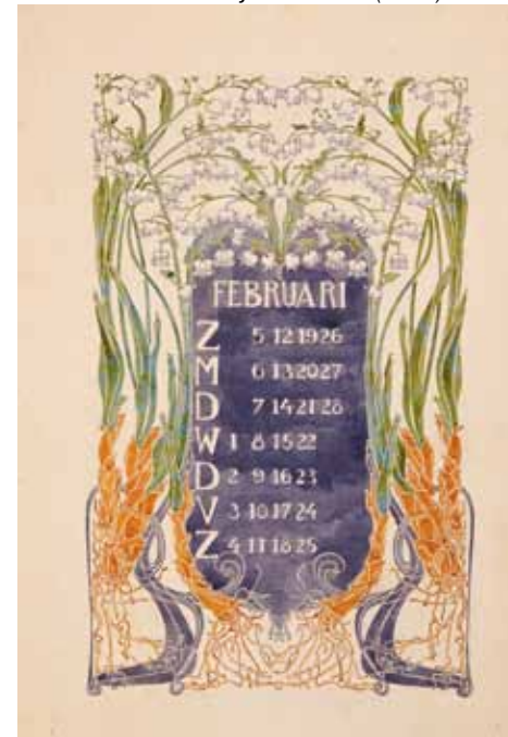
Afb. 4. Ontwerptekening voor een kalenderblad met lelietjes-van-dalen (1904).

Een paar jaar geleden vond ik bij antiquariaat Scheltema in Amsterdam zes aquarel-ontwerptekeningen en vijf bijbehorende proefdrukken voor Sipkema's bloem-en-blad-kalender van 1905. De kalenderbladen waren volgens de antiquair teruggevonden tussen de opgekochte restanten van boekhandel De Slegte, die in 2013 failliet was gegaan. Ze zijn waarschijnlijk afkomstig van de uitgever of drukker en hadden jarenlang onder op een stapel met 'nog uit te zoeken aankopen' gelegen. Jammer genoeg ontbraken er zes maanden, maar de overige bladen waren zo