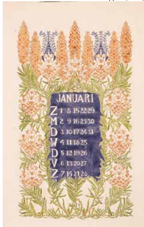
Afb. 3. Ontwerptekening voor een kalenderblad met dennenappels (1904).

P.N. van Kampen en L.J. Veen. Vooral haar boekbanden vielen in de smaak vanwege de sierlijke en elegante bandontwerpen (afb. 1). Daarnaast gaf Sipkema les aan de Dagteken- en Kunstambachtsschool voor Meisjes in Amsterdam. In die tijd was het gebruikelijk dat kunstenaars ook voor de klas stonden, omdat het kunstenaarschap – zeker voor vrouwen – te weinig bestaanszekerheid bood.