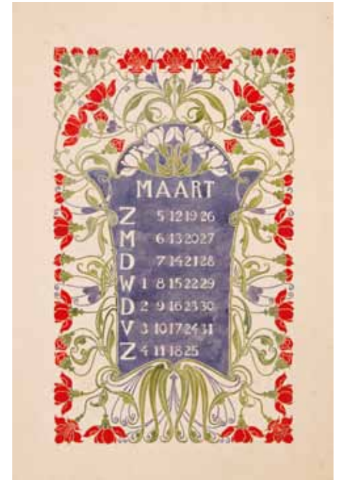
Afb. 5. Ontwerptekening voor een kalenderblad met tuinanjers (1904).

mooi dat ik ze niet kon laten liggen. Zowel de ontwerpen als de proefdrukken zijn waarschijnlijk niet vaak blootgesteld aan licht, want de kleuren zijn nog prachtig.