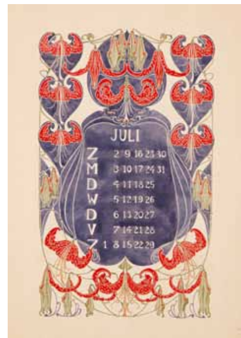
Afb. 7. Ontwerptekening voor een kalenderblad met Turkse lelies (1904).