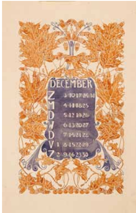
Afb. 8. Ontwerptekening voor een kalenderblad met eikenbladeren (1904).

In totaal heeft Van Dishoeck slechts vijf bloem-en-blad-kalenders uitgebracht, de laatste in 1905. We weten niet waarom de uitgeverij ermee stopte, maar wellicht had het te maken met een afnemende interesse in de 'buitenlandse' art nouveau, die in Nederland nooit vaste voet aan de grond kreeg. Ook Sipkema stopte enkele jaren later met het