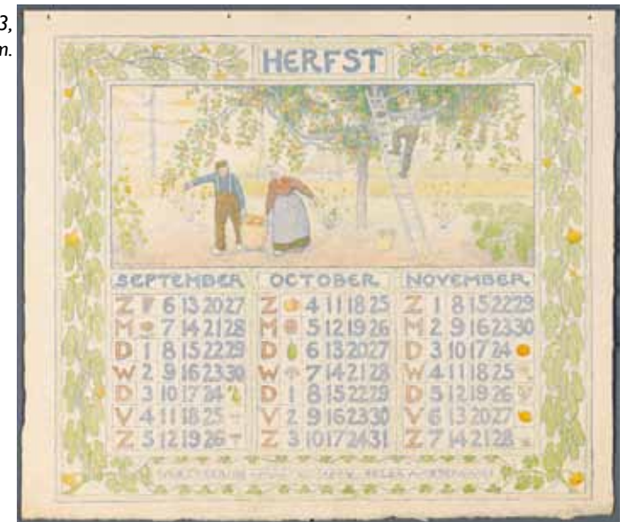
Afb. 3. Kalenderplaat uit 1903.

landse arbeidsongeschiktheidsverzekering, destijds 'werkkrachtverzekering' genoemd. 'Onontbeerlijk voor wie van zijn beroep afhankelijk is. Uitkeeringen bij ziekten, ongelukken en organische gebreken. Niets uitgesloten', aldus een krantenadvertentie uit 1900.