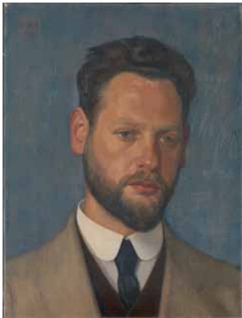
Afb. 2. Henk Meijer, portret van Michel de Klerk, collectie Amsterdam Museum.

In 1914 deed Meijer mee aan de driejaarlijkse prijsvraag van het Vrouwe Vigelius-legaat, dat werd beheerd door de Rijksacademie. Zijn inzending met als motto 'Nieuw Testament' werd door de jury - voorgezeten door Derkinderen - een 'kranige prestatie' genoemd en beloond met de eerste prijs in de categorie van 'het schoonste schilderij op historisch terrein, hetzij vaderlandsch of Bijbelsch onderwerp'.