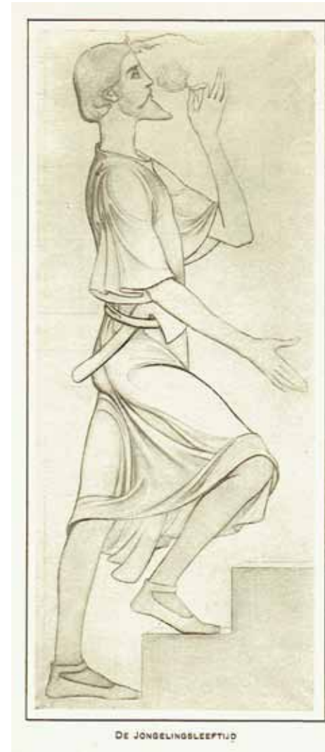
Afb. 8. Antoon der Kinderen, Trap des levens , muurschildering gebouw Algemeene Maatschappij van Levensverzekering en Lijfrente in Amsterdam.